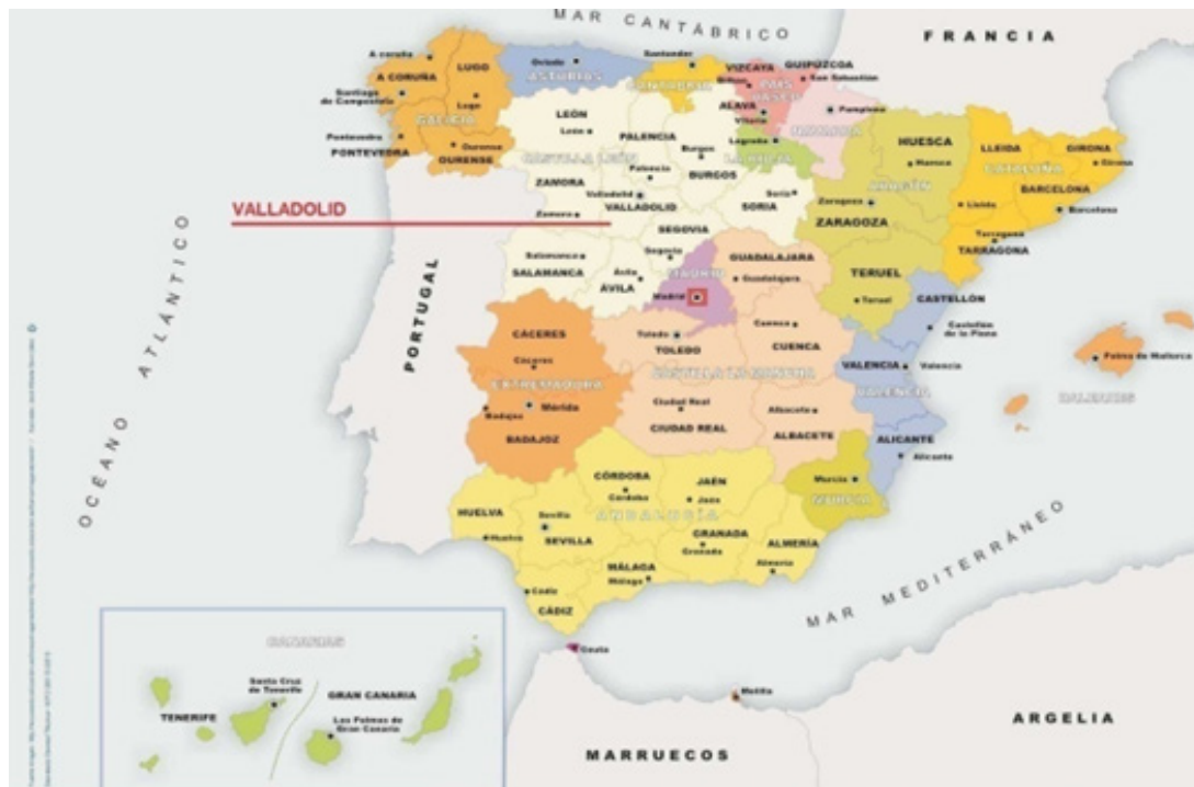
Figura 2. Mapa político de España en la actualidad con las 50 provincias agrupadas en sus correspondientes comunidades autónomas