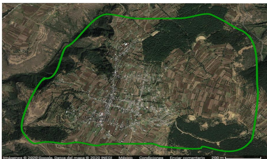
Figura No 1. Ubicación del ecosistema de estudio