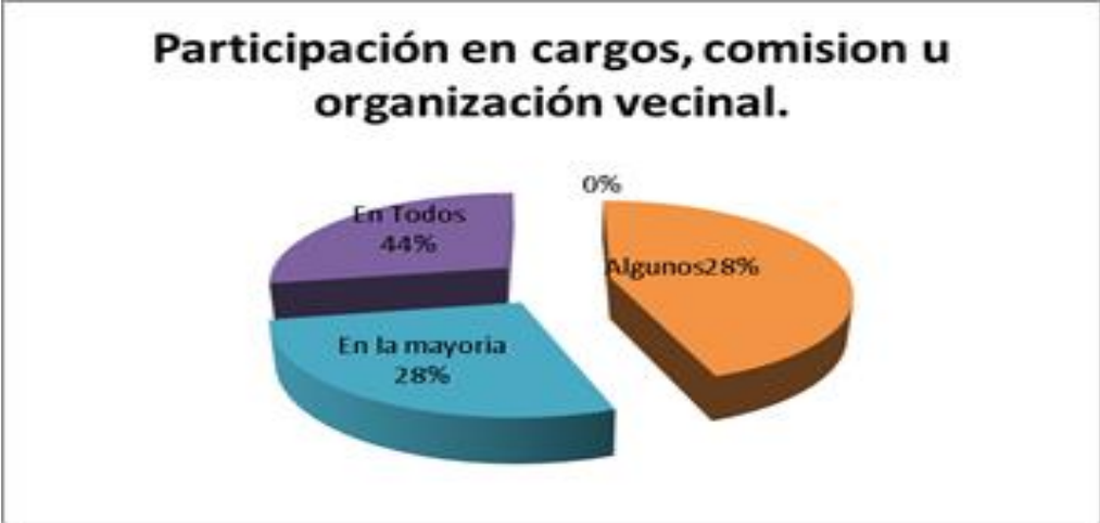
Figura No 4. Participación social .

En las narraciones antes expuestas se observa que la provisión de los bienes sociales y otros de consumo colectivo se generan a través de la colaboración de dos o más individuos y del impacto de las externalidades en el comportamiento de grupo, toda acción conjunta que persigue unos intereses comunes y que para conseguirlos desarrollan unas prácticas de participación en cargos, comisión u organización vecinal como así lo observan en la figura siguiente: